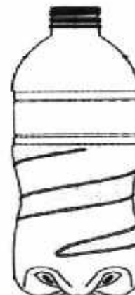
FIGURA 3: Vista en perspectiva lateral-inferior de la botella

Abog. Rossana F. Ojeda Aseretto Directora Interina