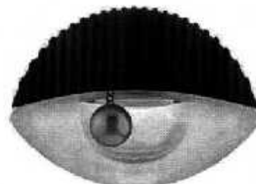
FIGURA 1 Vista en perspectiva del recipiente

El presente modelo industrial consiste en un RECIPIENTE CONTENEDOR EN FORMA DE ÓVALO, donde la novedad del frasco radica en un armazón con forma de casco de embarcación de base plana, el armazón presenta una paleta de forma circular en la parte superior y un frasco interno de forma semiesférica, un aro colocado en la parte superior de la paleta del armazón con una esfera que se le adhiere mediante una cadena y una tapa ondulada con forma de media luna.