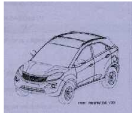
Figura 1: Vista frontal en perspectiva

La carrocería lleva un diseño afilado, que lo ayuda a tener un bajo coeficiente de resistencia contra el viento, posee barras longitudinales para porte bultos en el techo. Se potencia el diseño con una ornamentación y acabados refinados. Las características especiales se muestran en las figuras y se describen como sigue: